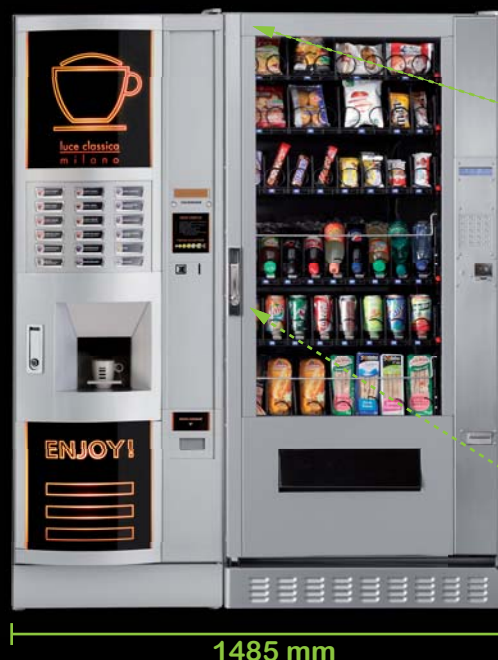
Duo LUCE METAL/ LUCE SNACK X PUBLICO

LUCE SNACK X PUBLICO peut être associé à l'ensemble de la gamme free standing chaud RHEAVENDORS pour une offre alimentaire complète et design.