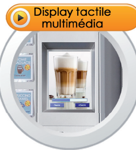
Dimensions : 120 mm x 90 mm / 5.9"

Compatible avec tout autre système de paiement.