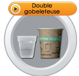
Gobelet plastique et/ ou carton de 15 à 30cl